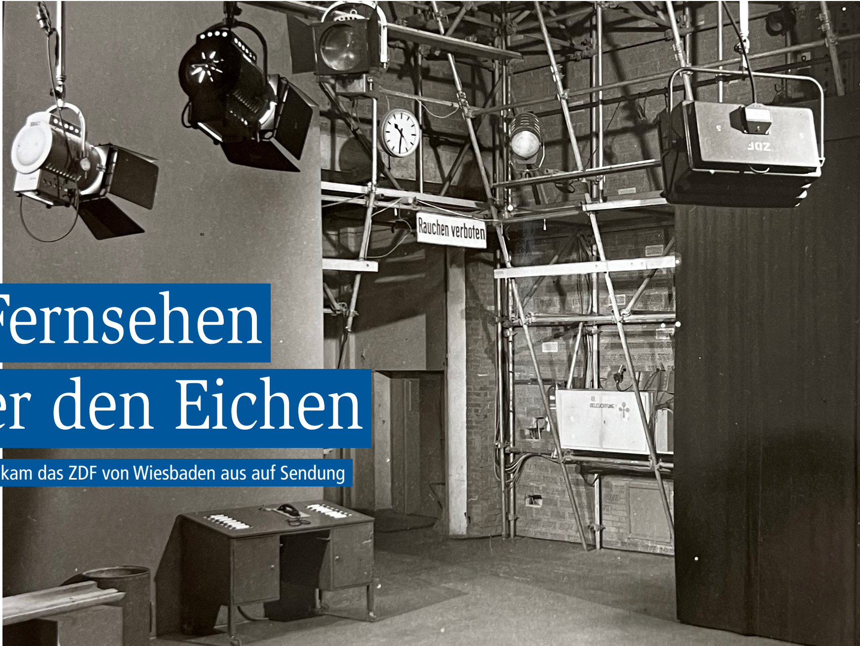
Einrichtung des ZDF-Studios Unter den Eichen.