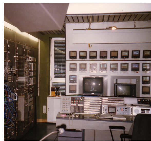
ZDF-Schallraum Unter den Eichen, 1984.