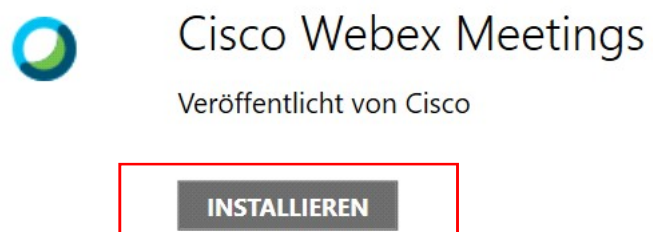
Abbildung 5: Cisco Webex Meetings installieren

Klicken Sie auf Cisco Webex Meetings und im folgenden Fenster auf Installieren .