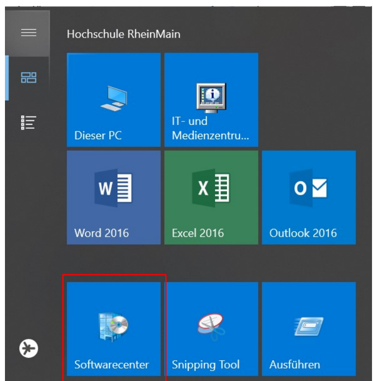
Abbildung 2: Softwarecenter im Startmenü

Im nun sich öffnenden Fenster klicken Sie auf Softwarecenter bzw. tippen Sie Softwarecenter ein, falls Sie den Eintrag nicht direkt sehen.