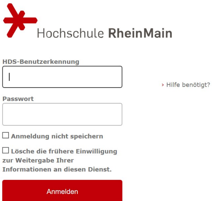
Abbildung 7: Webex Meetings Anmeldung – HDS-Benutzerdaten eingeben

In dem nächsten Feld müssen Sie Ihre Hochschul-E-Mail-Adresse eingeben. Nun sehen Sie ein neues Fenster. Melden Sie sich mit Ihren HDS-Benutzernamen und Passwort an.