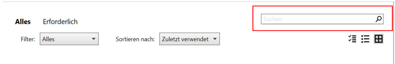
Abbildung 3: Cisco Webex suchen

Im geöffneten Fenster sehen Sie eine Suchleiste. Suchen Sie nach Cisco Webex Meetings .