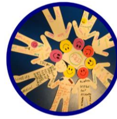
Abbildung 2: Eigenschaften, die eine hilfreiche Person haben sollte

This project is funded by the European Union's Rights, Equality and Citizenship Programme (2014-2020)