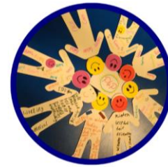
Abbildung 1: Was würdest du machen, wenn du Gewalt erfährst?