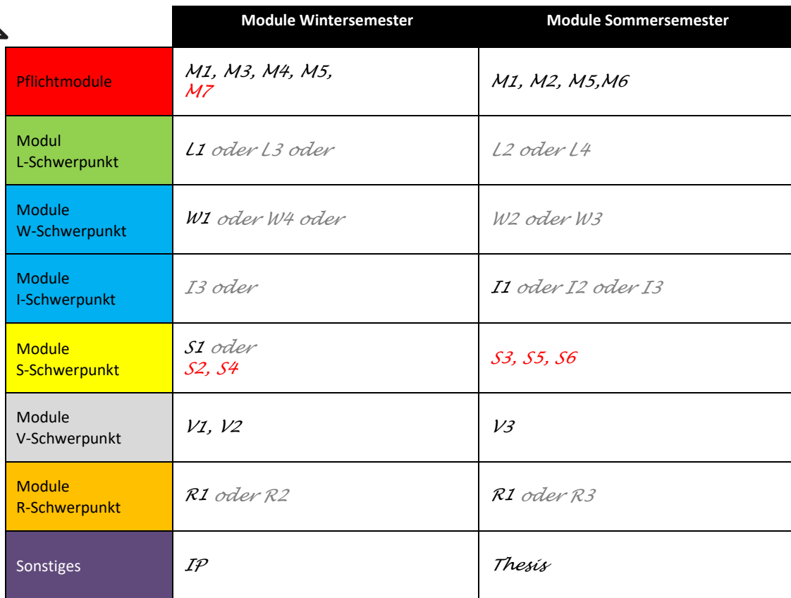
Tabelle 8: Einteilung der benötigten Module für den V- und S- Schwerpunkts getrennt in Winter- und Sommersemester.

Die roten Module benötigt man, um zusätzlich zum Verkehrsschwerpunkt auch den der Stadtplanung angerechnet zu bekommen.