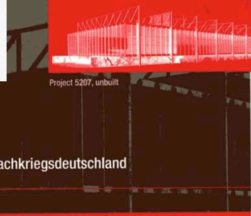
Project 5207, unbuilt

Mies in Postwar Germany The Mannheim Theater